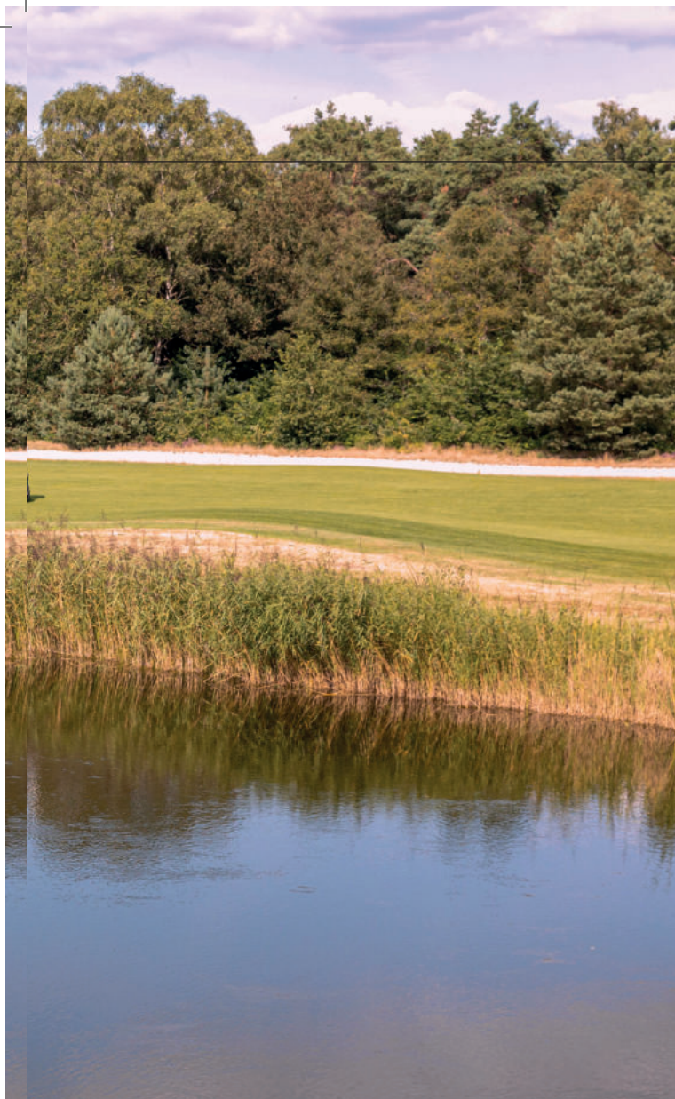
▶ VAN HOLE DRIE TOT EN MET ZEVEN BEN JE IN HET 'BUITENGEBIED'. DE BOMEN NEMEN AFSTAND, MAAR WATER KOMT NADRUKKELIJK IN HET SPEL.