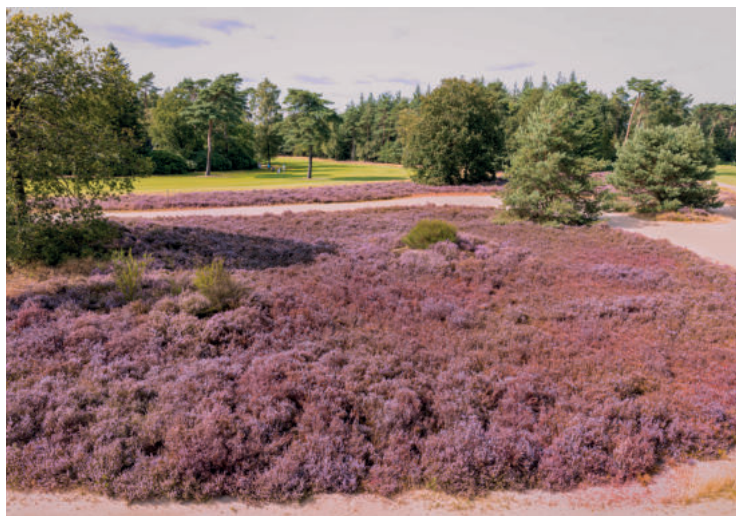
▶ HOLE ÉÉN IS MISSCHIEN IETS AF TE SNIJDEN, MAAR DE KANS IS GROOT DAT JE GESTRAFT WORDT MET EEN IN DE HEI VERLOREN BAL.