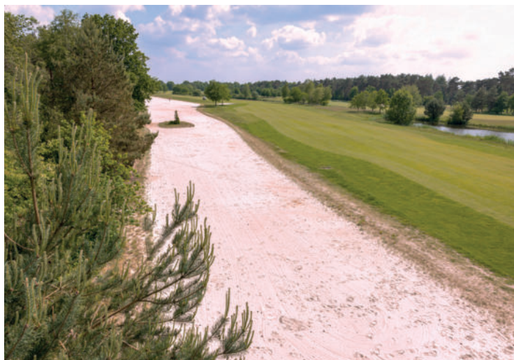
▶ EEN ENORME WASTE-AREA BESLAAT VRIJWEL DE HELE RECHTERZIJDEN VAN HOLE ZES.